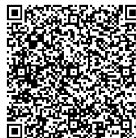
Синквейн как форма педагогической рефлексии